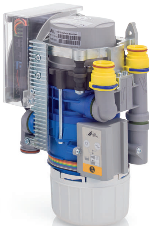
CAS 1 Combi-séparateur