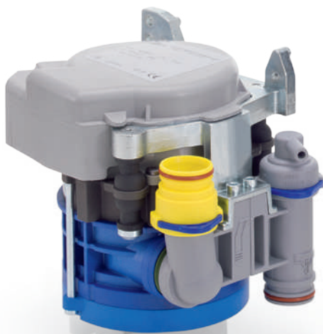
CS 1 Combi-Sepamatic

NOTRE OBJECTIF DE TRAVAIL CONSISTE À OBTENIR LE MEILLEUR RÉSULTAT POUR NOS CLIENTS