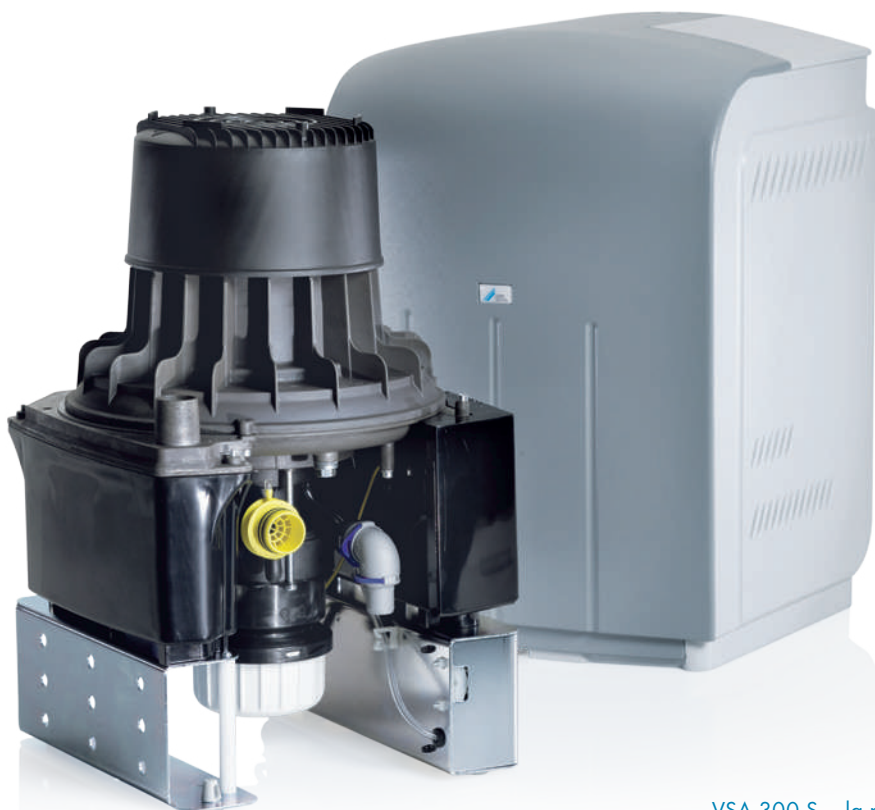
VSA 300 S – la première unité d'aspiration qui sépare et récupère l'amalgame